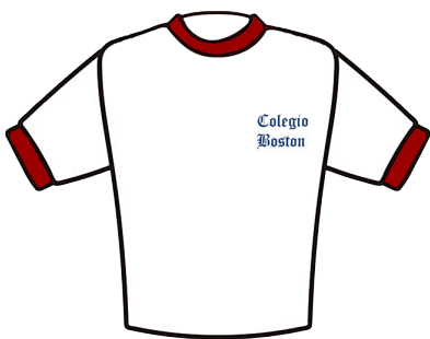
CHOMBA CON RIBETE ROJO

LAS Y LOS ESTUDIANTES DEBERÁN CONCURRIR LOS DÍAS DE DEPORTE Y EDUCACIÓN FÍSICA CON EL SIGUIENTE UNIFORME CONFORME AL ACTA ACUERDO INSTITUCIONAL. CUALQUIER ACCESORIO DEBERÁ SER AZUL O ROJO (GUANTES, BUFANDA, ETC).