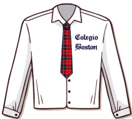
CAMISA Y CORBATA MANGA CORTA O LARGA

LAS Y LOS ESTUDIANTES DEBERÁN CONCURRIR TODOS LOS DÍAS CON EL SIGUIENTE UNIFORME CONFORME AL ACTA ACUERDO INSTITUCIONAL. CUALQUIER ACCESORIO DEBERÁ SER AZUL O ROJO (GUANTES, BUFANDA, ETC).