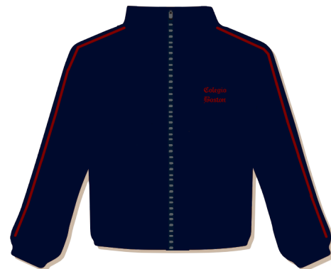
CAMPERA DE ABRIGO