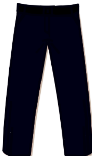
PANTALÓN DE VESTIR AZUL